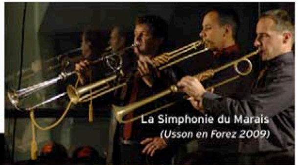
La Simphonie du Marais (Usson en Forez 2009)