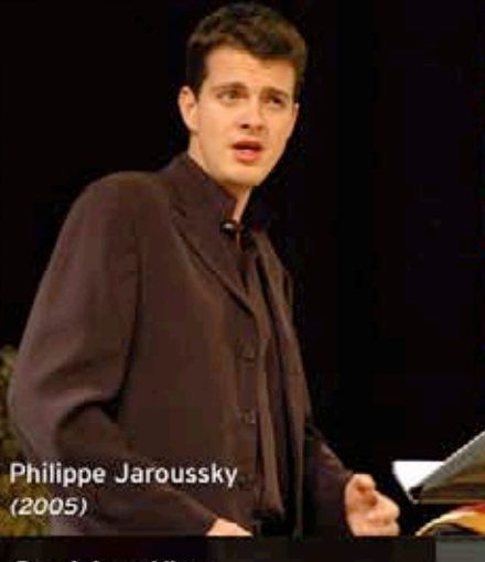
Philippe Jaroussky (2005)