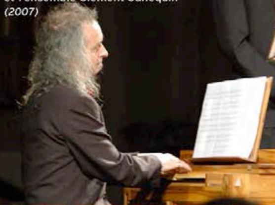
Dominique Visse et l'ensemble Clément Janequin (2007)